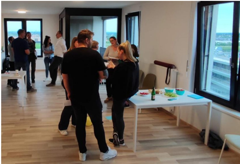
Foto-Dokumentation des Infoabends